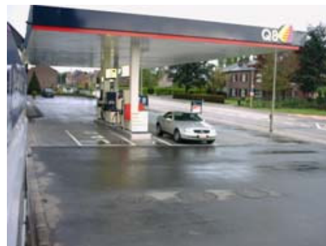
Afbeelding: Type WP-800SD